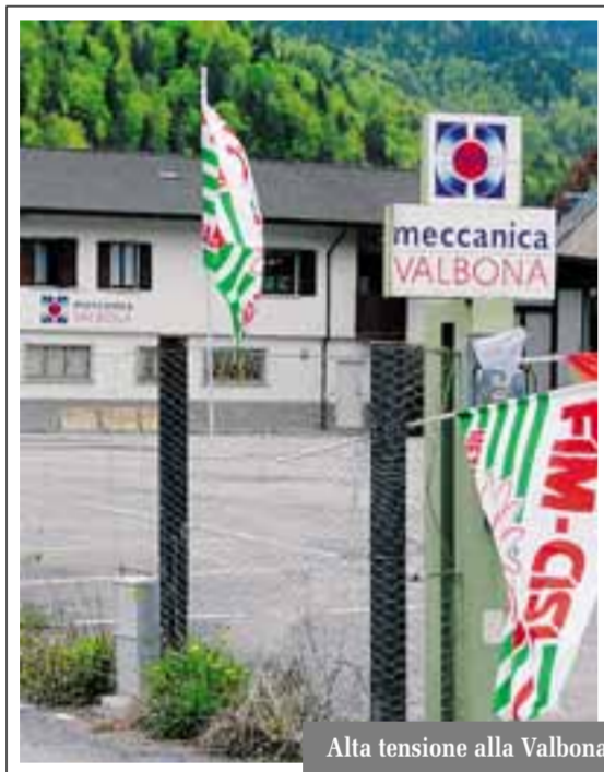
Alta tensione alla Valbona